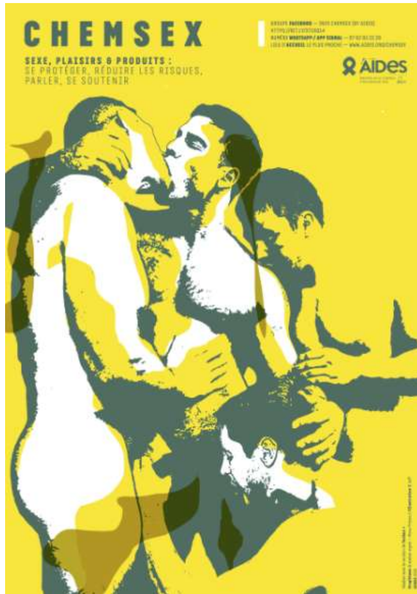
Dépliant AIDES – Chemsex – Cathinones/3MMC Aides.org/chemsex