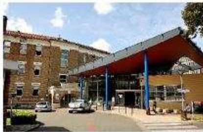
GHI Le Raincy – Montfermeil